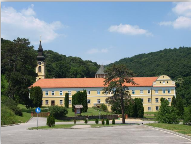
Манастир Ново Хопово на Фрушкој Гори