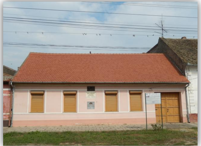
Доситејева родна кућа у Чакову

Следовање ове историје показаће да сам ја по вишој части савршен узрок имао с људма, с којима сам живио, задовољан бити; но то приписујем њи[x]овој доброту. Толико могу уверити, да ако је што добра и с моје стране било, заисто узроковато је било чрез всегдашње спомињање мојега доброга оца којему и данашњи дан желим уподобити се и тако љубезног спомињања браће моје и рода сподобити се. Зато, како сам обештао, намах при овој прилици нећу изоставити родитељем напоменути да се старају сами са својим повотком деци својеј у време младости њи[x]ове